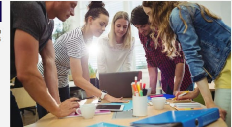
Kokemuksellista oppimista ja itsensä haastamista kuntoutuksen simulaatioiden avulla